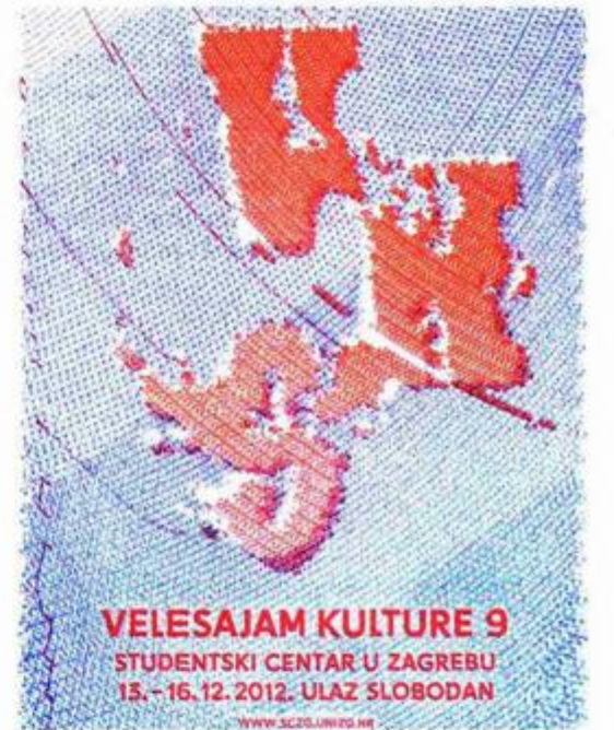
Dario Dević i Hrvoje Živčić sinonim su za svjež dizajn